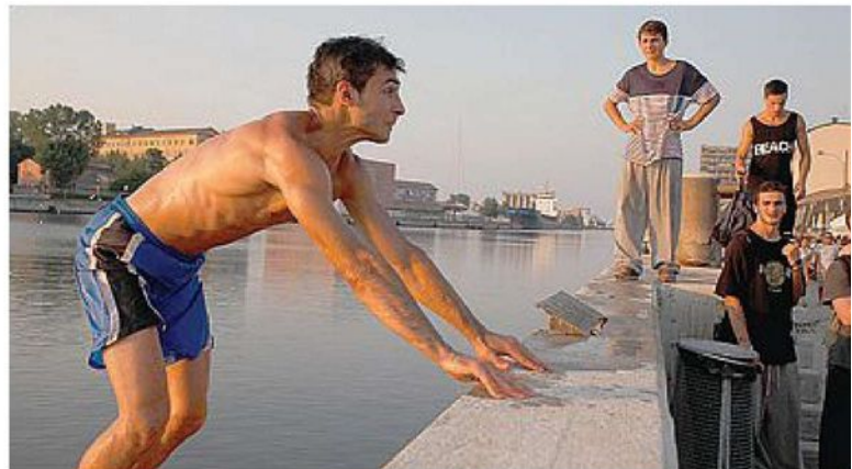
TEMERARIO Uno dei ragazzi del parkour si è tuffato nel Candiano

Recuperato un progetto legato alla candidatura: una mappa dei luoghi visionari e del divertimento