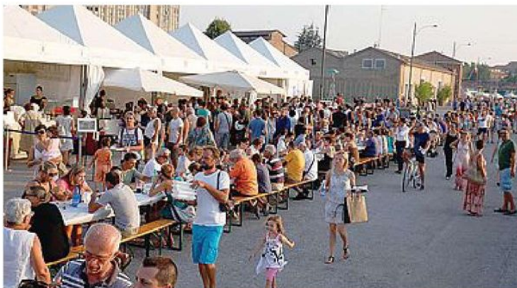
GASTRONOMIA Menu per tutti i gusti lungo la banchina