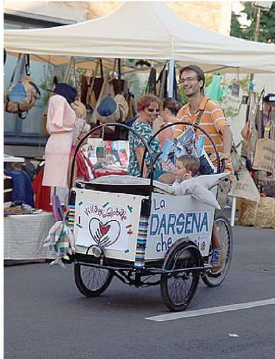
DIVERTIMENTO Un carrettino riadattato