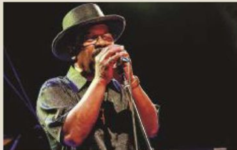
● ARFELLI a pagina 23

Esmeralda & Lillo, Cafè Touba, Kris blues band e Del Barrio Metalizado